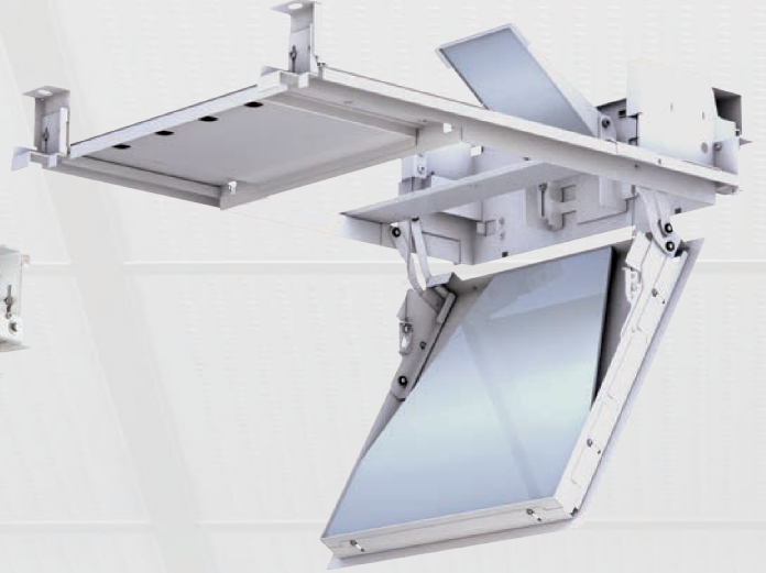
Ceiling mirror Compact